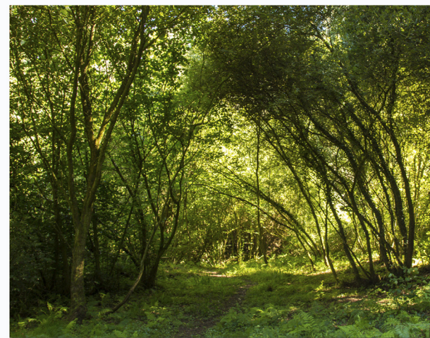
La vegetación propia del encinar cantábrico abraza a la cueva prehistórica de El Juyo