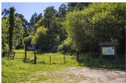
Acceso al Paraje de La Cueva del Juyo con panel informativo

En el municipio de Camargo, localidad de Igollo , barrio de El Juyo, se encuentra este área natural con la cueva prehistórica del mismo nombre y el encinar que la rodea. En sus proximidades está la carretera CA-310, y a escasa distancia: al este la autovía S-30. Ronda de la Bahía y al norte la autovía A-67. Cantabria-Meseta.